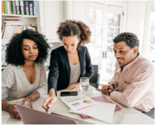
Evolução e Organização da Gestão Pública