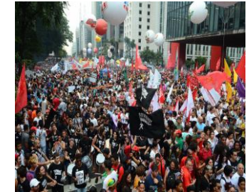
Gestão de Conflitos e o Poder da Comunicação