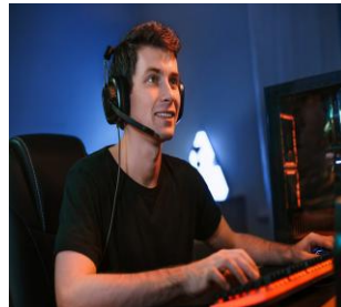
Inovação e Tecnologias