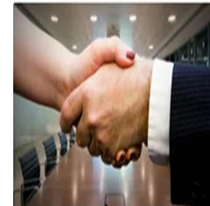
Técnicas de Negociação