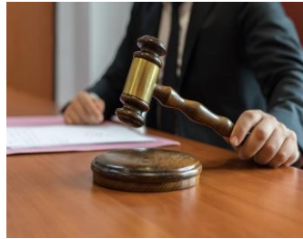
Legislação e Regulamentação