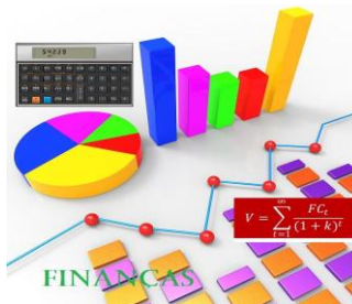
Elaboração e Gestão do Orçamento Público