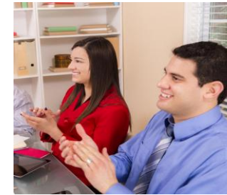
Tomada de Decisão por Fatos