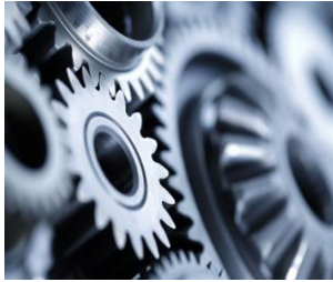
Gestão por Processos