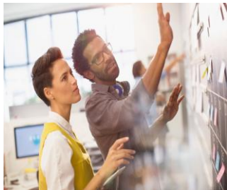
Gestão de Projetos