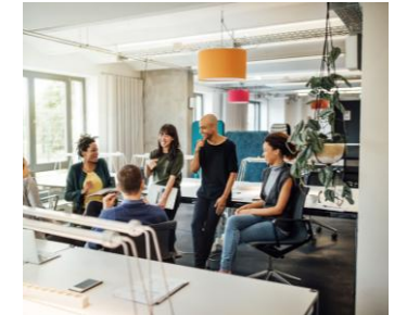
Gestão e Liderança de Pessoas