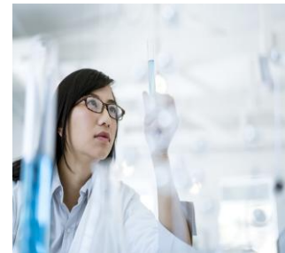
Qualidade Total e o Cidadão como cliente