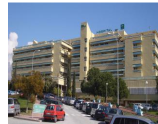
Gestão Patrimonial e Materiais